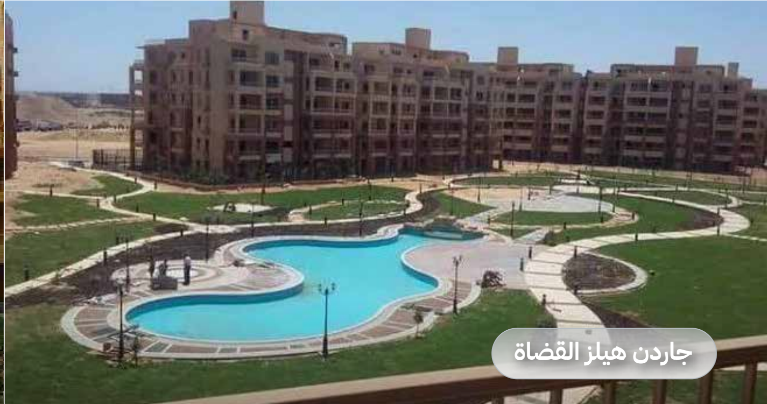
جاردن هيلز القضاة