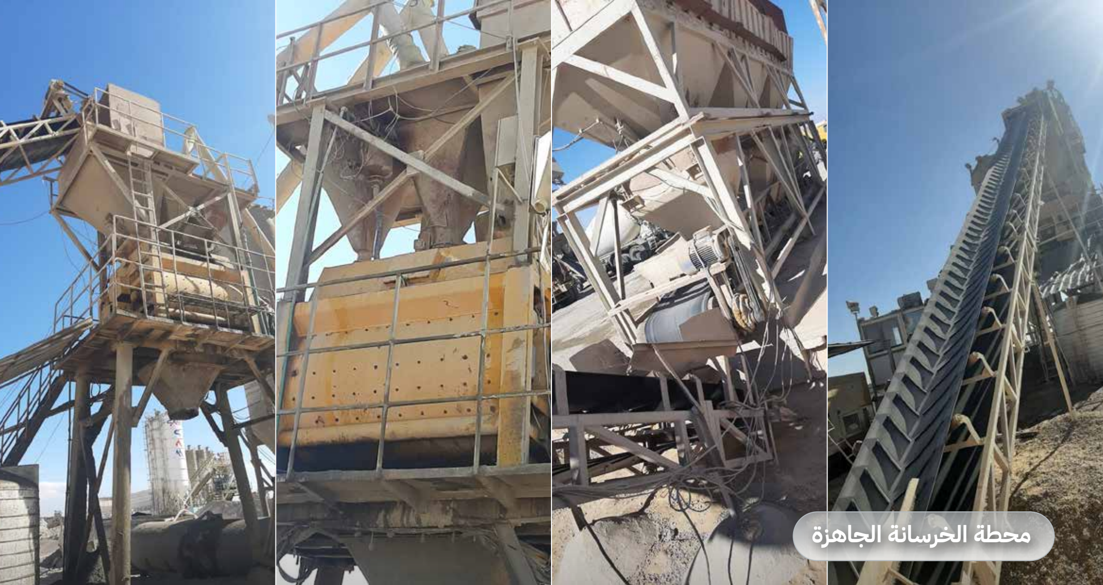
محطة الخرسانة الجاهزة